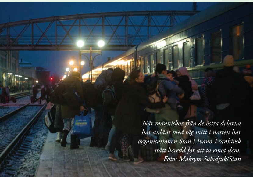
När människor från de östra delarna har anlänt med tåg mitt i natten har organisationen Stan i Ivano-Frankivsk stått beredd för att ta emot dem.