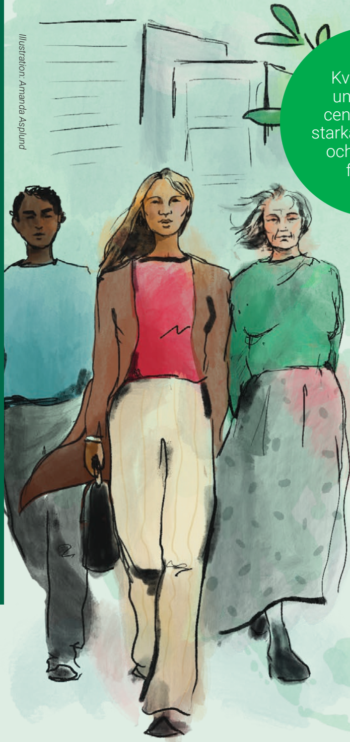
Illustration: Amanda Asplund

Kvinnor och ungdomar i centrum – för starka samhällen och en jämlik framtid.