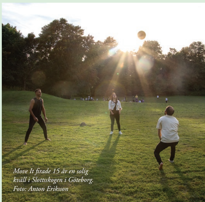
Move It firade 15 år en solig kväll i Slottsskogen i Göteborg.

Deltagarna har fått testa allt från bowling, orientering och skidåkning till bågskytte, ridning och soppåseäkning. Men de har också fått göra många andra slags aktiviteter som att besöka fritidsgårdar, gå på teater och titta på olika idrottsmatcher som Move It har fått biljetter till. Vad gruppen gör beror på volontärernas kontakter och intressen kombinerat med upparbetade samarbeten med lokala föreningar.