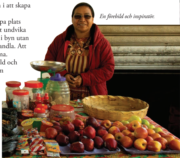
En förebild och inspiratör.