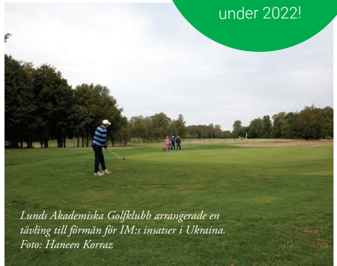
Lunds Akademiska Golfklubb arrangerade en tävling till förmån för IM:s insatser i Ukraina.

för alla gåvor som IM har fått under 2022!