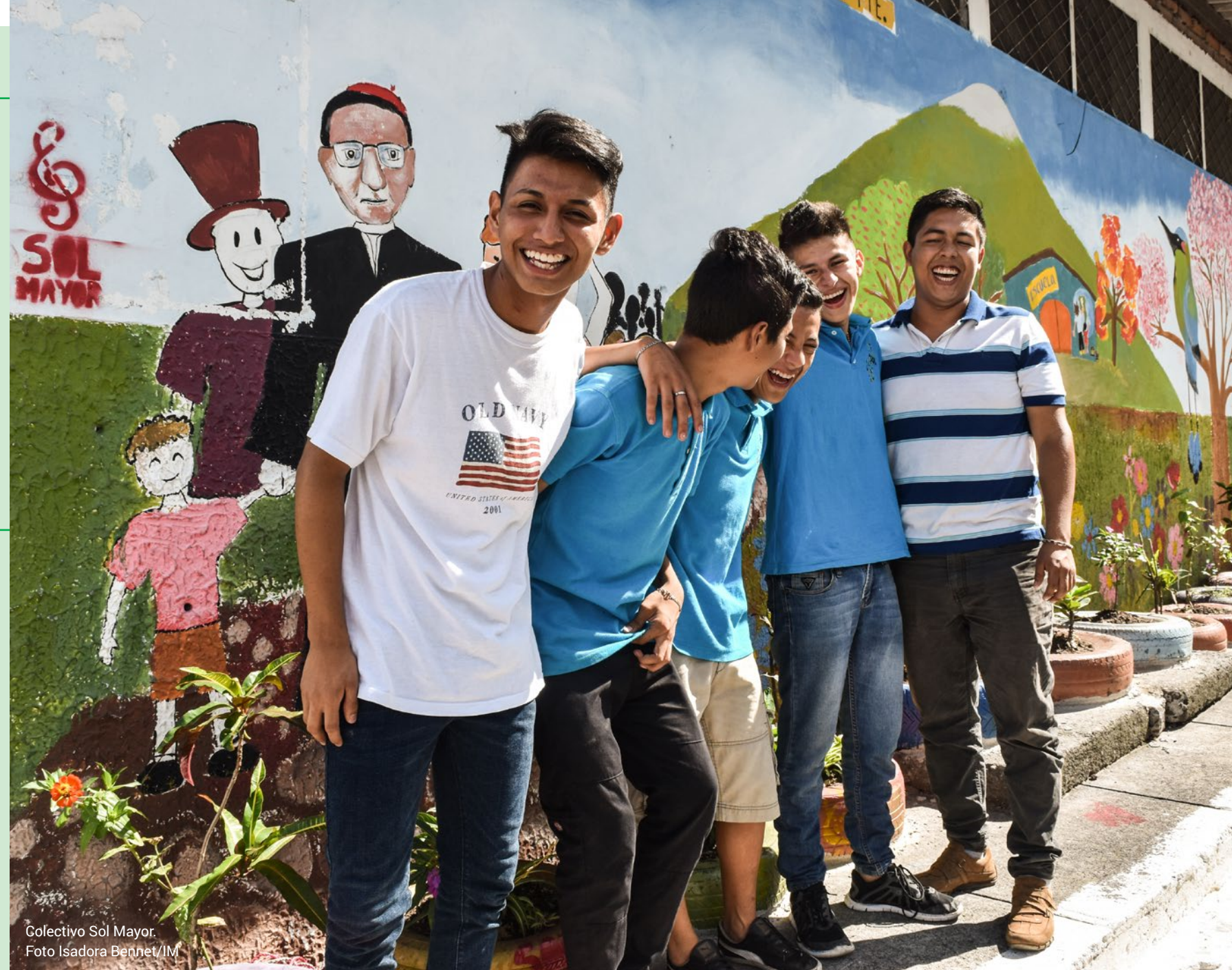
Colectivo Sol Mayor.

I Sverige gör rasism, diskriminering och bristande insatser att nya svenskar riskerar att hamna i utanförskap. Tillsammans med våra lokalföreningar arbetar IM för att skapa olika aktiviteter och mötesplatser för att både nya och etablerade svenskar ska mötas och tillsammans skapa ett inkluderande Sverige.